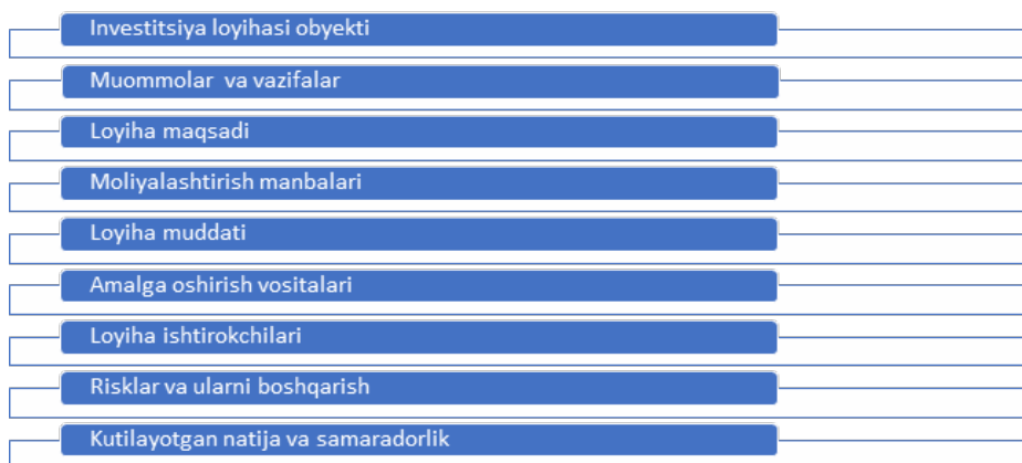
3-rasm. Investitsiya loyihasining asosiy elementlari

Shu bilan birga, loyihaning qaysi manbadan moliyalashtirilishi, unda qarz va o’z mablag’lari ulushi, ishtirokchilar tarkibi, amalga oshirish vositalari hamda loyihadan olinadigan iqtisodiy natijalar va samaradorlik bo’yicha kutilmalar loyihaning barcha subyektlari uchun muhim ahamiyat kasb etadi.